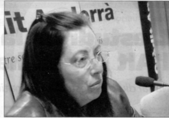
Mach va avançar que al desembre sortirà l'últim llibre de les Jornades.