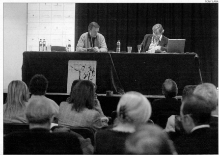
►► Un moment de la conferència a la sala d'actes de la Llucana, ahir.