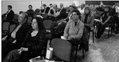
Una trentena d'assistents van escoltar a les conferències a La Llucana.